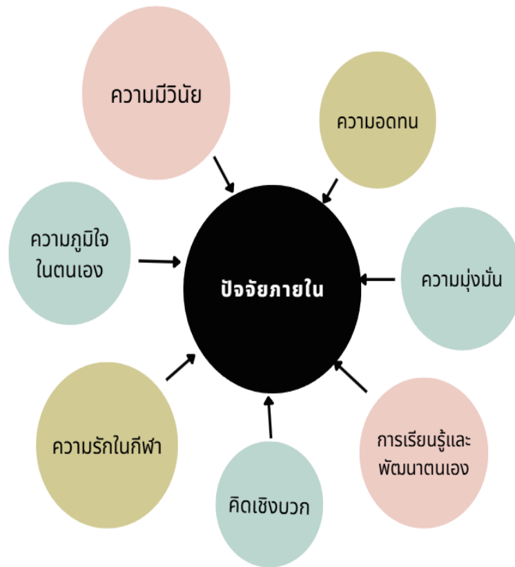
ภาพที่ 1 ปัจจัยภายในที่ส่งผลต่อความสำเร็จของนักกีฬาว่ายน้ำคนพิการทีมชาติไทย